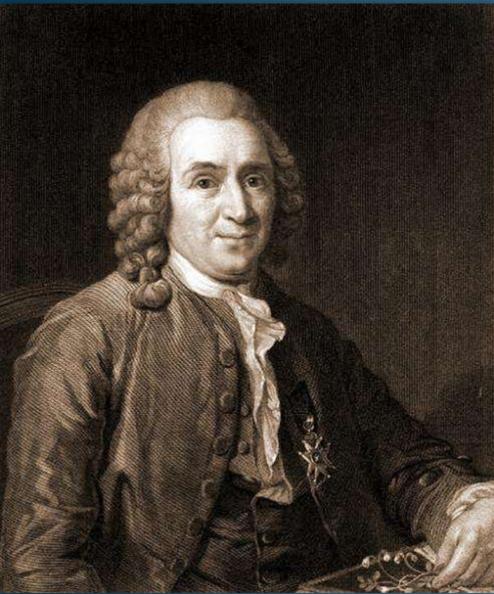
Карл Линней (1707-1778)