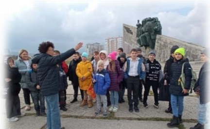
Экскурсия по памятным местам города

Младшие школьники с удовольствием и пользой участвуют в различных экскурсиях, изучения историческое прошлое родного края и знакомясь с новым.