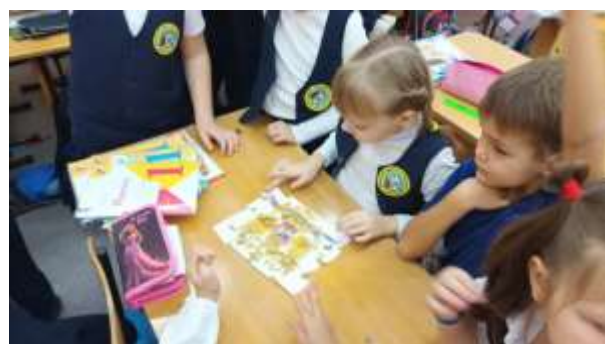
Подготовил Ефременко Яромир

Мне это мероприятия понравилось, так как мы сообща подготовились к нему, ребята нас внимательно слушали, не перебивали, благодарили за рассказ. Идея собрать пазл, по моему мнению, была очень удачна, многие сумели проявить свои организаторские способности и внимательность к деталям.