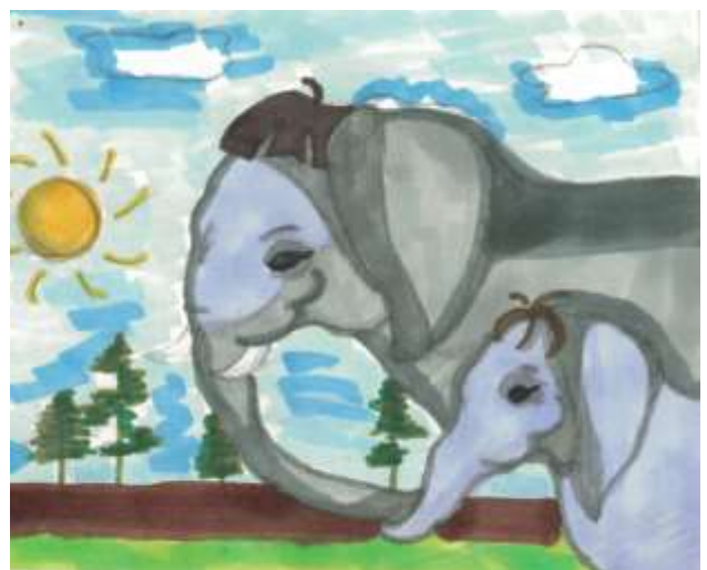
Афонин Константин, 4 «Б», иллюстрация Харченко Аталей